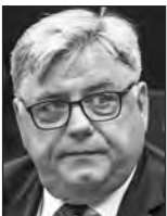
5ème questeur Kosma ZLOTOWSKI ECR / Pologne

Email : fabienne.keller@europarl.europa.eu