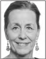
4ème questeuse Fabienne KELLER RE / France

Email : miriam.lexmann@europarl.europa.eu