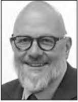
2ème questeur Marc ANGEL S&D / Luxembourg