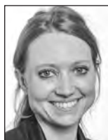
Présidente Aurore LALUCQ S&D / France

Email : aurore.lalucq@europarl.europa.eu