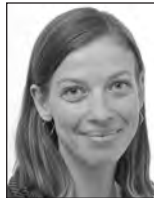
Présidente Li ANDERSSON GUE/NGL / Finlande