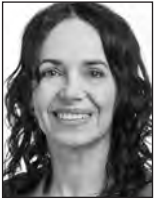
3ème questeuse Miriam LEXMANN PPE / Slovaquie

Email : miriam.lexmann@europarl.europa.eu