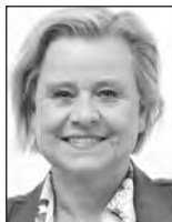
Présidente Veronika VRECIONOVÁ ECR / République tchèque

Email : veronika.vrecionova@europarl.europa.eu