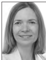
Présidente Anna CAVAZZINI Verts/ALE / Allemagne

Email : anna.cavazzani@europarl.europa.eu