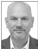
Président Niclas HERBST PPE / Allemagne

Email : niclas.herbst@europarl.europa.eu