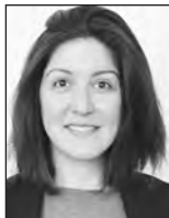
Relations presse Cheida ANDRÉ

52, rue de la Victoire F-75009 Paris Tél. +33 (0)1 40 63 40 00 Email : epparis@ep.europa.eu Facebook : @parlement.europeen.france Twitter : @PE_FRANCE www.europarl.europa.eu/france